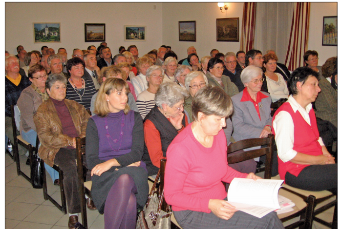
Az ünnepi alakuló ülés közönsége