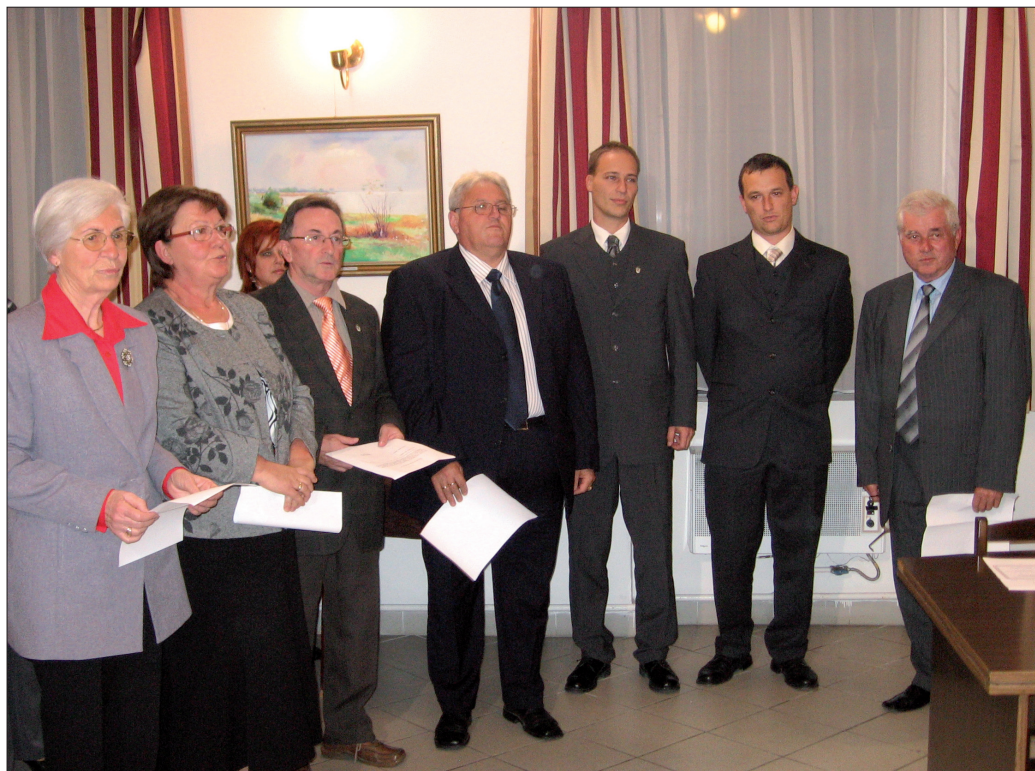
Az önkormányzati bizottságok külső szakértői

Csopak fejlődése, közös munkánk eredményessége érdekében a továbbiakban is partnerségre töreksem mindazokkal, akik segítségüket ajánlják községünk fejlődése érdekében. Céлом, hogy Csopak maradjon továbbra is szerethető, élhető, békés és fejlődő település, ezért fogunk dolgozni és ehhez kérjük a továbbiakban is támogatásukat.