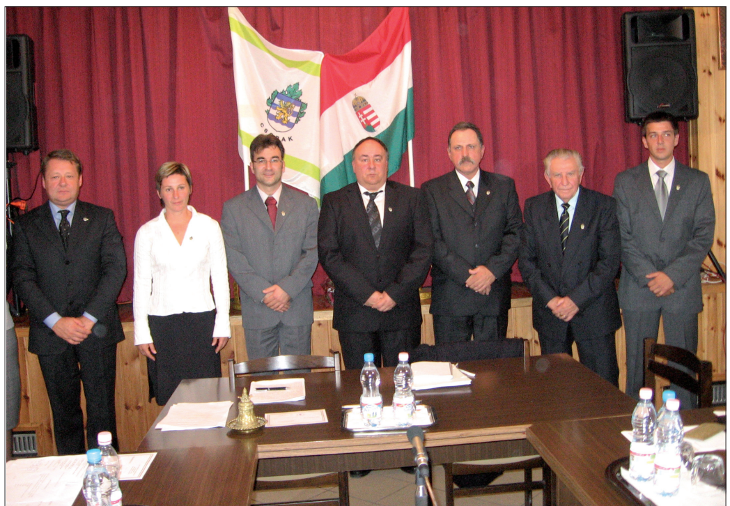
A csopaki önkormányzat képviselő-testülete