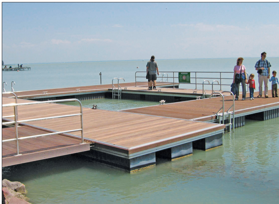
Felső képen a Balaton parti strandokon is különlegességnek számító napozó stég gyermekmedencével

A strandon ivókút, valamint egy meteorológiai adatszolgáltató állomás is helyet kapott, hogy a strandon és az interneten is a csopaki strand időjárési körülményeit mindenki nyomon követhesse.