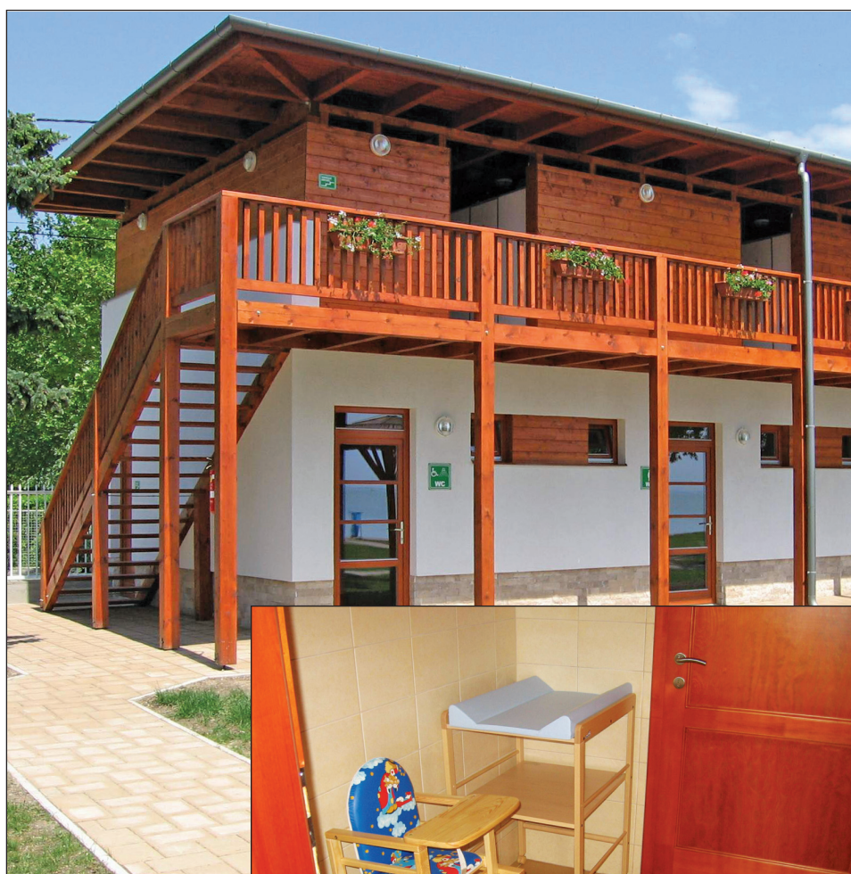
Az impozáns kétszintes vizesblokk 48 kabinnal