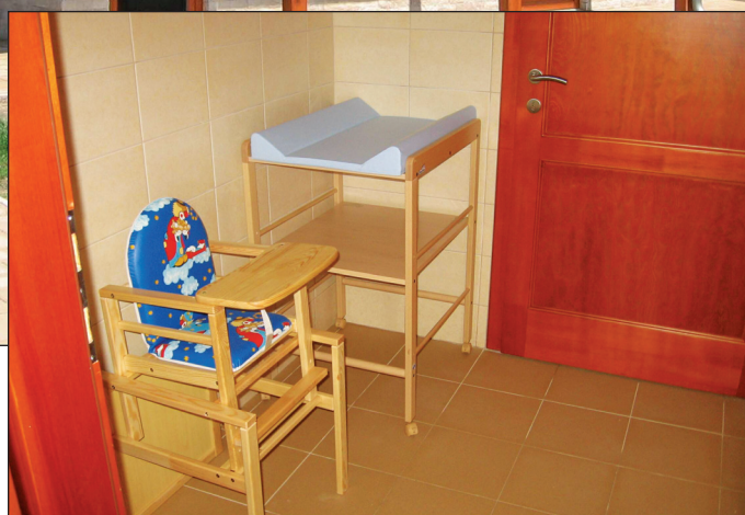
Baba-mama szoba pelenkázóval