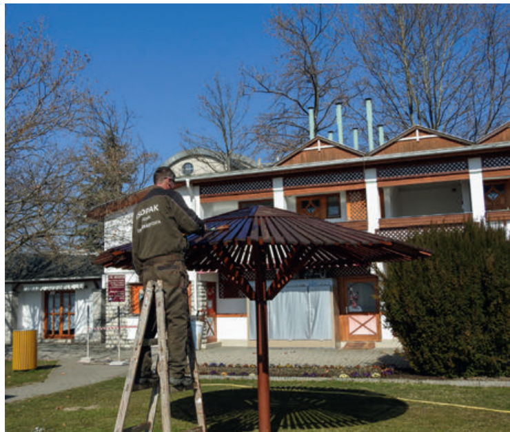
Megkezdődtek a strandon is festések, felújítások.

A gondos kezelésnek köszönhetően szépen áttelelték a cserépes és kiültetett leandereink, reméljük a szabadban is mielőbb megcsodálhatjuk őket!