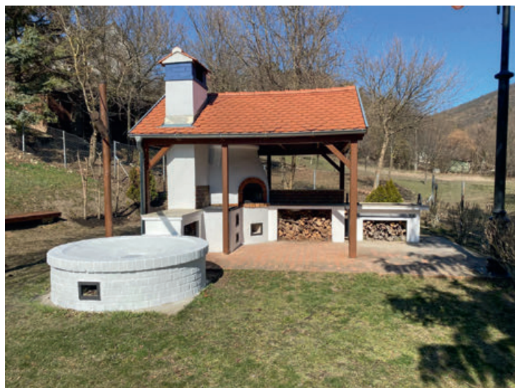
Gazdasági ágazatunk jóvoltából a Plul Malom mellett lévő „gasztro-sarok” is szépen felújítva várja a tavaszt!