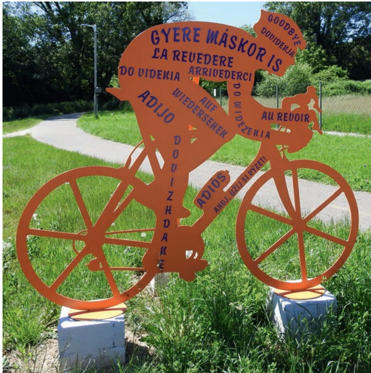
A kerékpárút Balatonfüred felőli végén

A kerékpárút mentén Csopakara beérve új szobrok üdvözlik a kerékpárosokat!