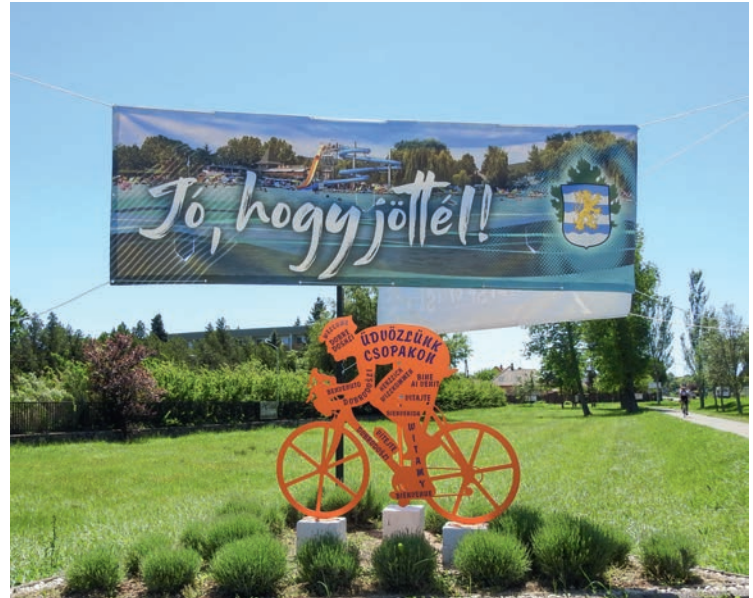
A kerékpárút Paloznak felőli végén

Kérjük a szelfit készítő kerékpárosokat a növényekre vigyázzanak!