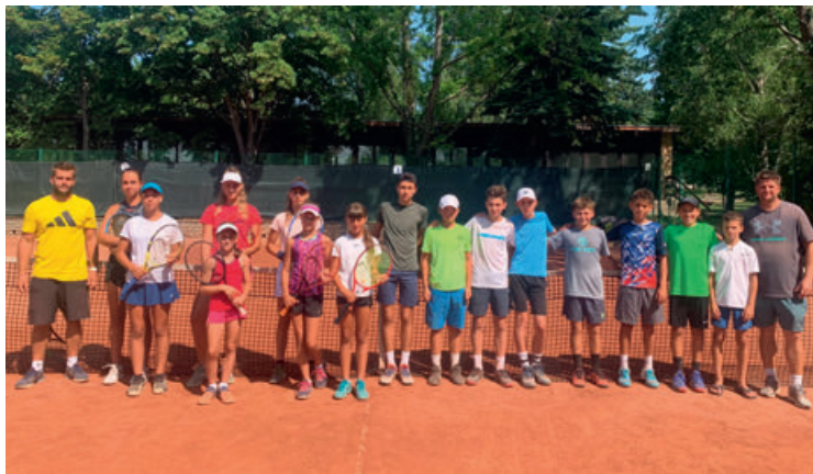
Csopak Teniszklub szervezésében az Országos Bajnokságára felkészítő professzionális edzőtábor volt Csopakon