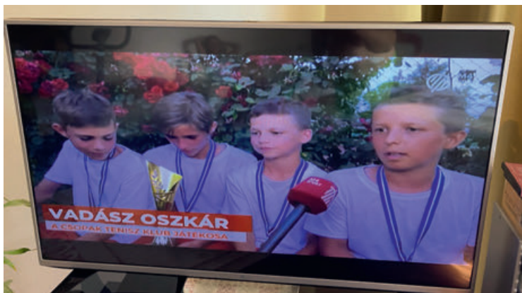
A győzteseknek nem csak teniszezni, hanem nyilatkozni is tudni kell