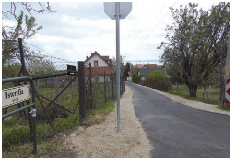
Elkészült az Arany János utca aszfaltozása

A beruházás a Vidékfejlesztési Program, VP6-7.2.1-7.4.1.2-16 kód-számú külterületi helyi közutak fejlesztése pályázat keretében, összesen 20.533.243,-Ft vissza nem térítendő támogatással valósulhatott meg.