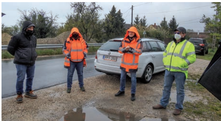
Megkezdődtek a munkálatok

Az érintett útszakaszon forgalomkorlátozásokra lehet számítani. Kérjük a lakosságot, hogy az érintett utcákban fokozott figyelemmel közlekedjenek!