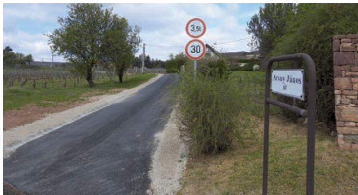
Elkészült az Arany János utca aszfaltozása

A II. Rákóczi- és Bencze László utcák után elkészült az Arany János- és Istenfia utcák útburkolatának felújítása is.