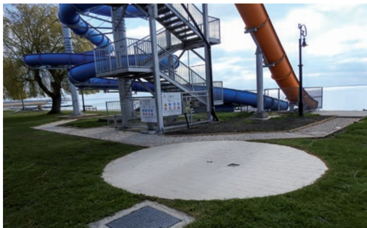
Kialakításra kerül a vízciszták kétoldali megközelítését biztosító járdaszakasza

Mindezeket túl önkormányzatunk önerőből újjátotta fel az öltözőépület emeleti szintjére vezető külső lépcsőfeljárót és közlekedőfelületet. Új labdafogó hálót kapott a strand nyugati oldalán található strandfoci pálya, illetve a strand többi területével harmonizáló árnyékoló pergola került kialakításra a strand nyugati bejáratánál lévő zöldterületen.