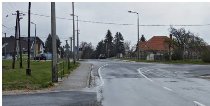
Hamarosan körforgalom segíti a forgalmas csomóponton való áthaladást