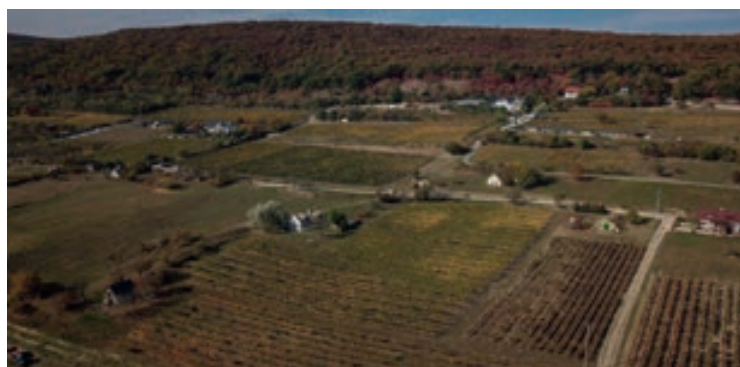
Szent Donát Birtok - Slikker 2018 Homola Pince - Hajnóczy 2018 Homola Pince - Sáfránkert 2018 Petrányi Pince- Szitahegy 2018