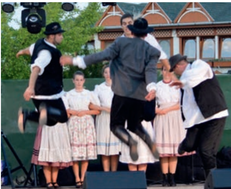
A néptáncosok fellépését hatalmas vastaps követte

Augusztus 17-én, csütörtökön este a Csupaki Táncművészeti Egyesület táncosainak fergeteges műsorával nyílt meg a hagyományos Csupak Napok a Fürdő utcai nagyszínpadnál.