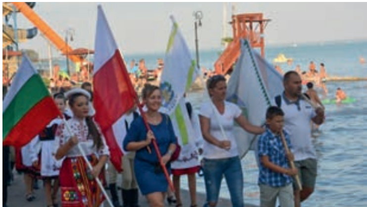
Látványos bevonulással, népviseleti ruhában érkeztek a fellépők a strandra

Csopak testvérvárosai - Lengyelországból Myslenice, Bulgáriából Kavarna és Erdélyből Szováta és a házigazda Csopak tánc és énekcsoportját nézhették az érdeklődők az ötszillagos strand víziszinpadán. A késő esti program a lengyel Dixi Band koncertjével zárult.