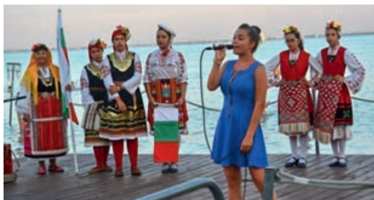
A kavarnai küldöttség jól ötvözte a hagyományos és modern zenei elemeket és a táncot