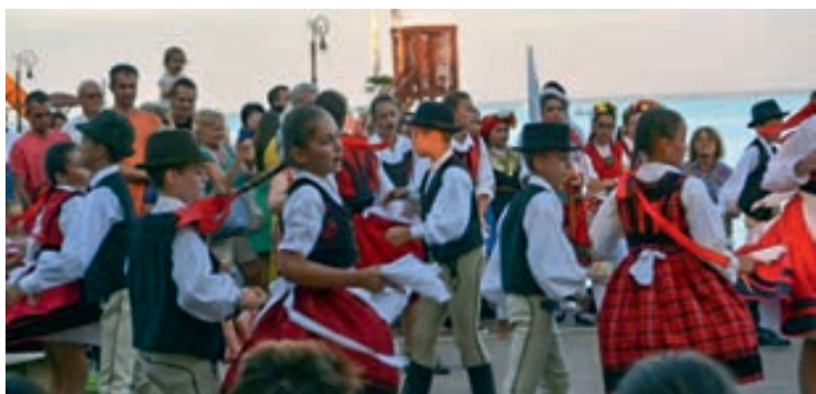
A szovátaai gyemecsoport mindenkit elvarázsolt