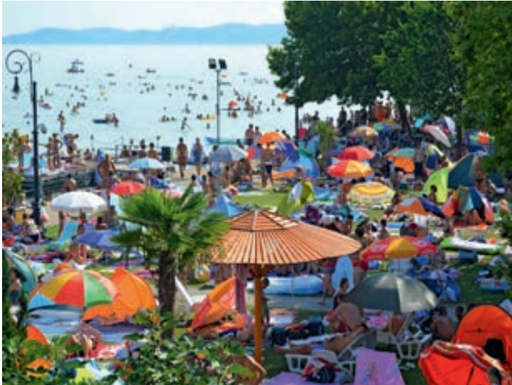
Május utolsó hétvégén megnyitotta kapuit a csopaki strand

A szülőknek és az újszülöttnek jó egészséget, sok örömet kívánunk!