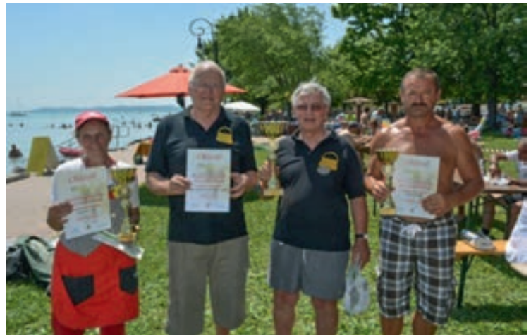
A halászléfőző verseny helyezettjei

A meghívásos versenyekre az idei évben hat főzőcsapat mérte össze tudását, egyenként 4-4 fővel, a halfogó versenyen pedig 4 csapat versengett 3-3 fővel.