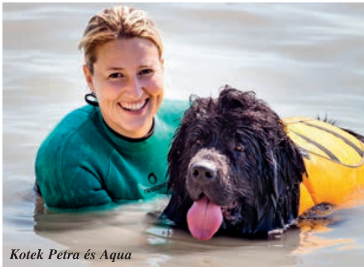
Kotek Petra és Aqua

A tanév utolsó napjaiban a Csupaki Református Általános Iskola diákjainak a település jóvoltából lehetőségük nyílt részt venni egy új, preventív jellegű programban, melynek célja, hogy a gyerekek a nyári szünidőben biztonságosan strandolhassanak.