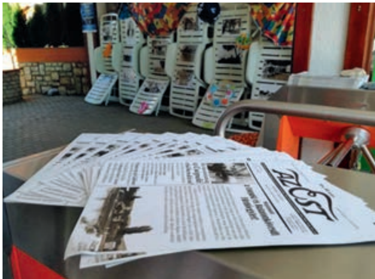
A strand főbejáratánál fotókiállítás köszöntötte a strandra érkezőket

2017. július 29-én, egész napos programsorozattal ünnepeltük a községi strand 1927-es megalakulását, a 90. születésnapot.