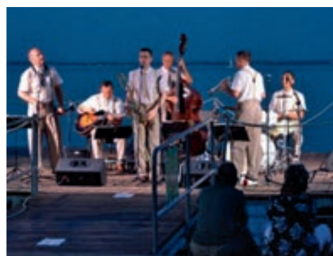
Majd este fantasztikus koncertet adott a Hot Jazz Band a vízi színpadon, a több száz nézős közönség legnagyobb örömeire