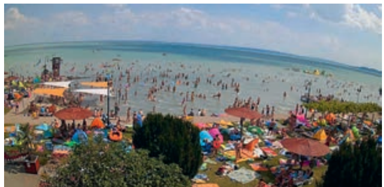
Idén is sokan választják a csopaki strandot