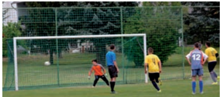
Az ifik tizenegyesből szépíthettek