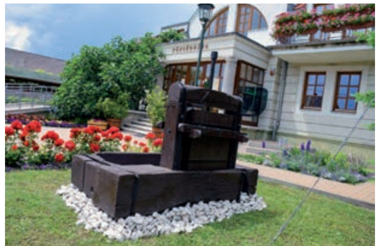
Június első hétvégéjén a községháza előtt felállítottuk az 1800-as években készült prést, tovább szépítve Csapakot.

De Trianon mégse arra emlékeztessen, milyen becstelenség történt velünk, hanem arra, hogy velünk soha többé nem lehet diktátumot elfogadtatni. A legfontosabb európai döntésekben egy ország is vétőjoggal élhet. Fogjunk össze, hiszen az igazi demokrácia nem felül van, nem Budapesten vagy Brüsszelben. Az igazi erő a településeken van. Közös erővel pedig egy nagyszerű jövőt tudunk építeni.”