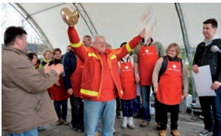
A győztes csapat