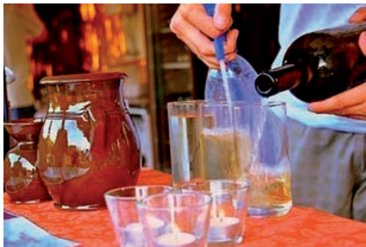
Július 9. - Július 12. - Csopaki Fröccsöntő - Fűrdő utcai parkoló, Rendezvényszínpad