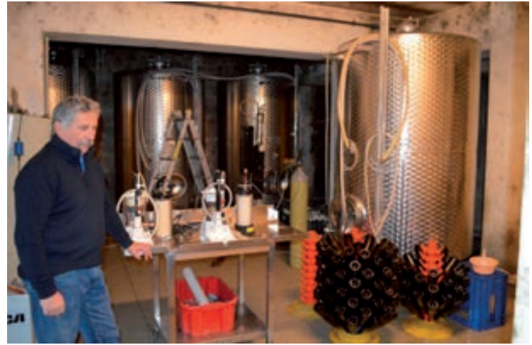
Hamarosan kezdődik a palackozás

ijedtek a gazdák és nagyon odafigyeltek a borkészítés során. Összességében megállapíthatjuk, hogy jó, átlagos évjáratú borok voltak a bormustrán.