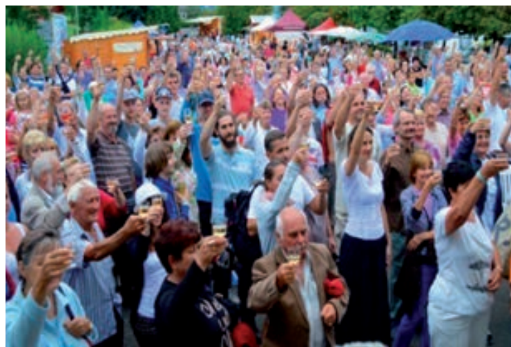
Augusztus 15. - Augusztus 20. - Csopak Napok - Fűrdő utcai parkoló, Rendezvényszínpad