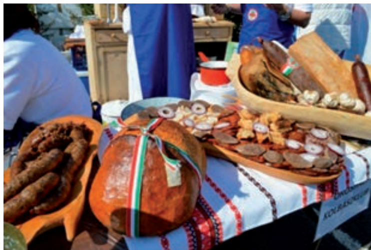
Március 21. - Csopaki Boros Toros - Fűrdő utcai parkoló, Rendezvényszínpad