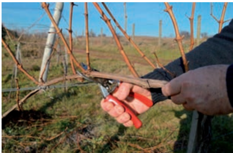
Fontos a szakszerű metszés