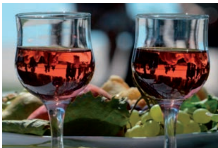
Május 23. - Május 24. - Pünkösdi Borpiknik - Fűrdő utcai parkoló, Rendezvényszínpad