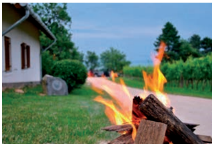
Június 20. - Olaszrizling éjszakája - Csopak Strand, valamint a résztvevő pincék