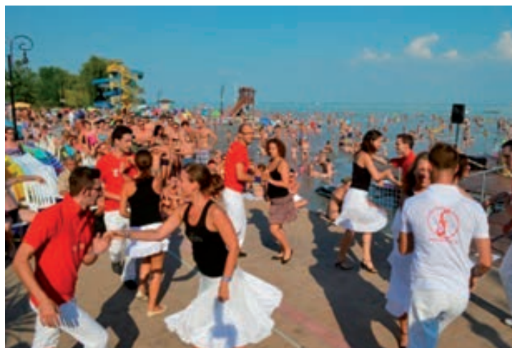
Augusztus 1. - Augusztus 2. - Csopakabana - Csopak Strand