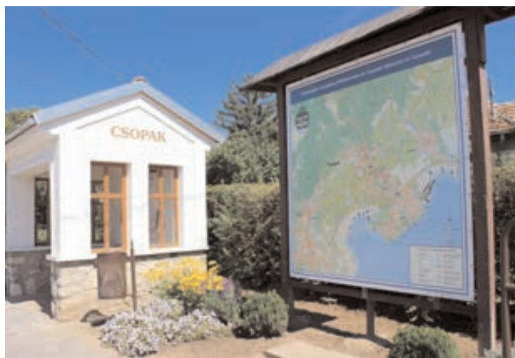
Elkészültek Csopak új köztéri térképei. Mindegyik nagyobb, szebb, áttekinthetőbb és naprakész lett