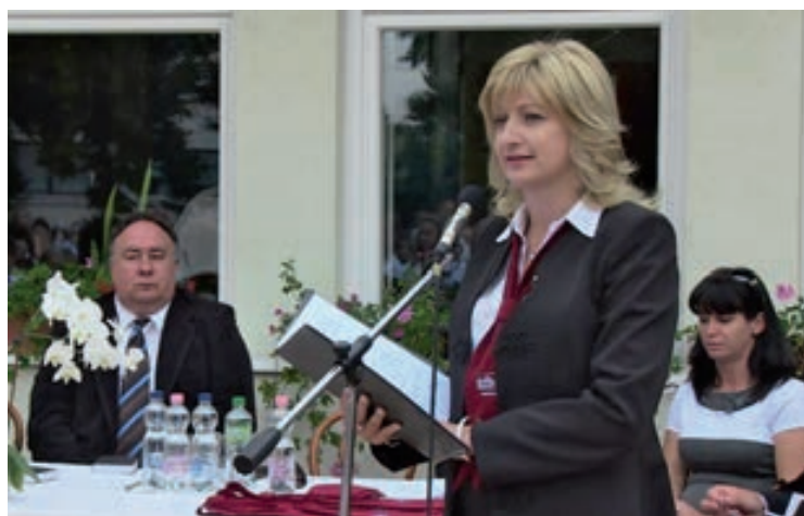
Az évnyitóval elindult a tanév a Csopaki Református Általános Iskolában (Bővebben a következő számban)