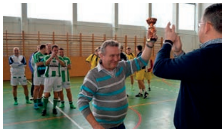
Répccemente csapata a harmadik helyen végzett