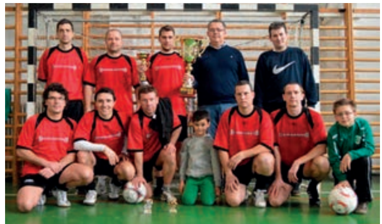
A teremfoci és a vándorkupa is a győrieké lett