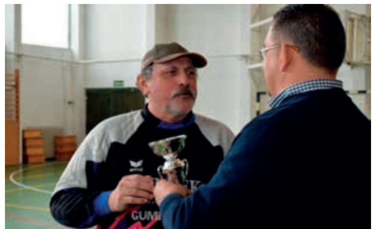
Csupak a második,