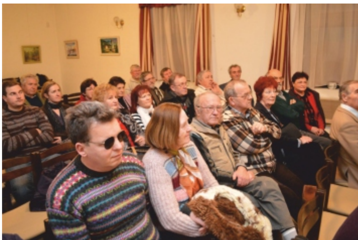
A Sáner János Kertbarát Kör tagjai a Kultúrházban