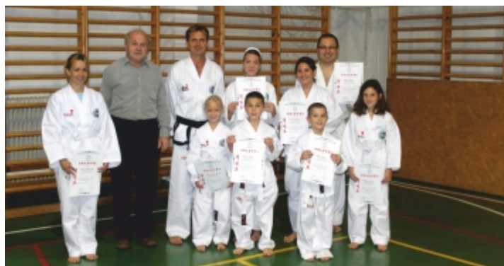
Sikeres vizsgát tettek a csopaki hullámtörők

Az edzéseket kedden 17.30-18.30-ig valamint pénteken 17.00-18.00-ig tartom a Csupaki Református Általános Iskola tornatermében, a munkába bármikor be lehet csatlakozni. Tavasztól őszig, amikor az időjárás lehetővé teszi, a szabadban (is) edzünk. Az edzésekkel kapcsolatban a 06 30 504 8711 telefonszámon lehet érdeklődni, vagy a gabordas1@gmail.com e-mail címen. Persze a legjobb, ha az érdeklődők személyesen jönnek le valamelyik edzésre, ahol meg is nézhetik, vagy ki is próbálhatják az edzést.