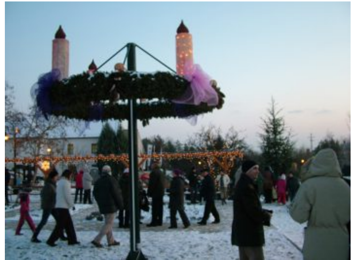
A faluban hagyomány a gyertyagyújtás