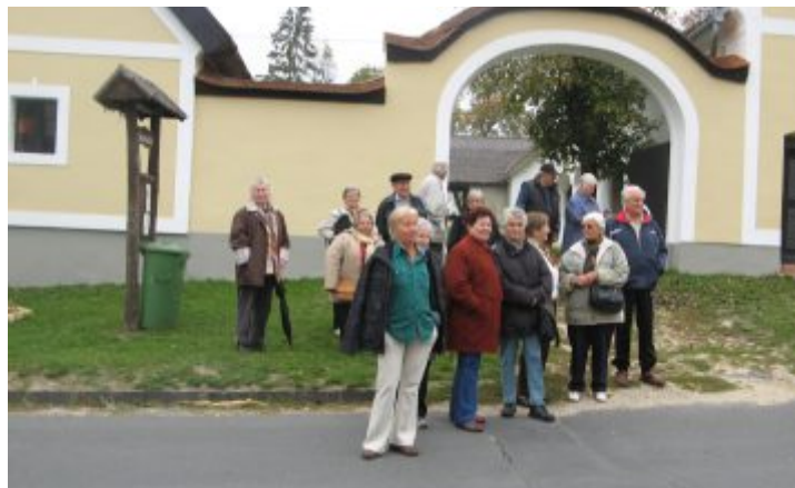
Csupaki nyugdíjasok a Bakonyban