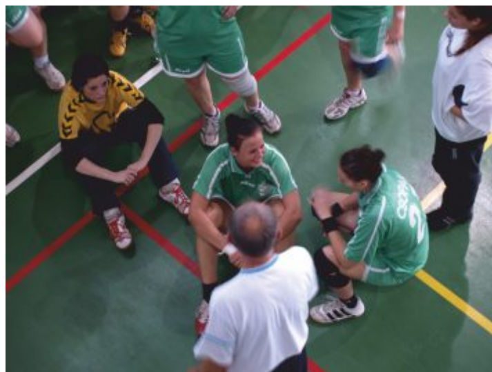
Mester és tanítványai