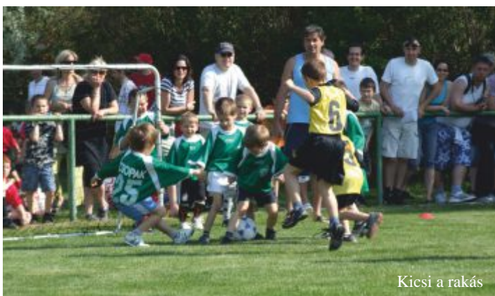
Kicsi a rakás