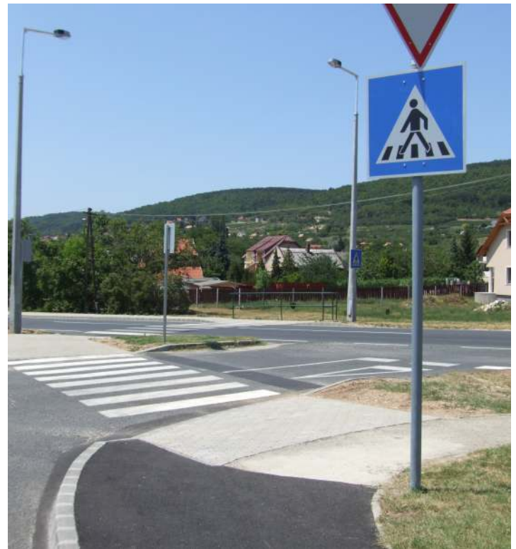
Új gyalogátkelő a 73-as úton