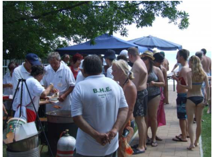
Szépen fogyott a halászlé