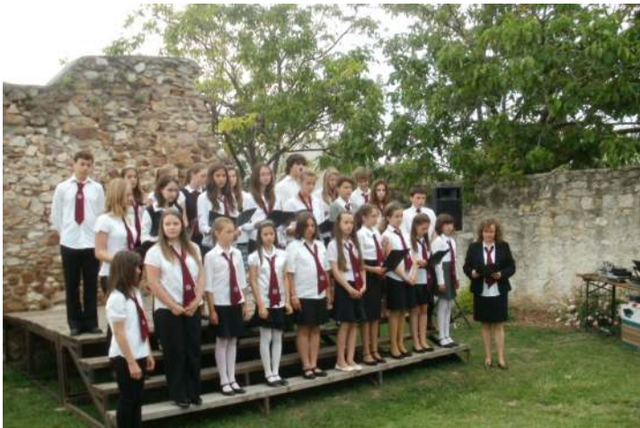
Az iskolások ünnepi műsora

(folytatás a 2. oldalon „Trianonra emlékeztek” címmel)