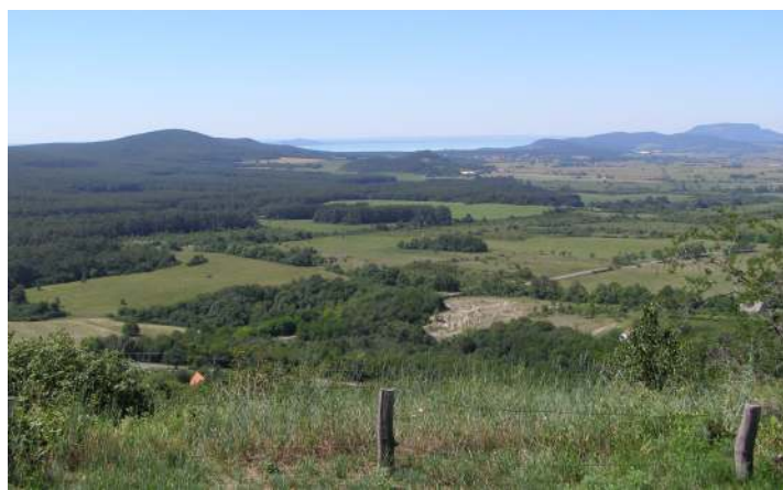
A megismételhetetlen Káli-medence