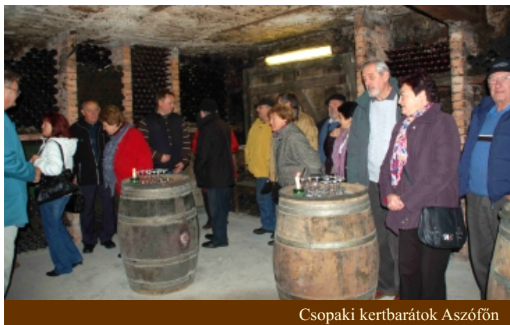
Csopaki kertbarátok Aszófőn

A csopaki Sáner János Kertbarát kör tagjai 2012. november 17-én délután Aszófőre utaztak. A 40 fős társaság összetételében, zömmel házastársak, és borászatkedvelők voltak. Utazásunk célja az volt, hogy megismerhessük egy szakember által irányított, nagyüzemi technológiával működő borászat tevékenységét aminek eredményeként - a palackokba zárt végtermék kóstolásával - alakíthassuk ki véleményünket, illetve szerezzünk tapasztalatot további saját munkáinkhoz.