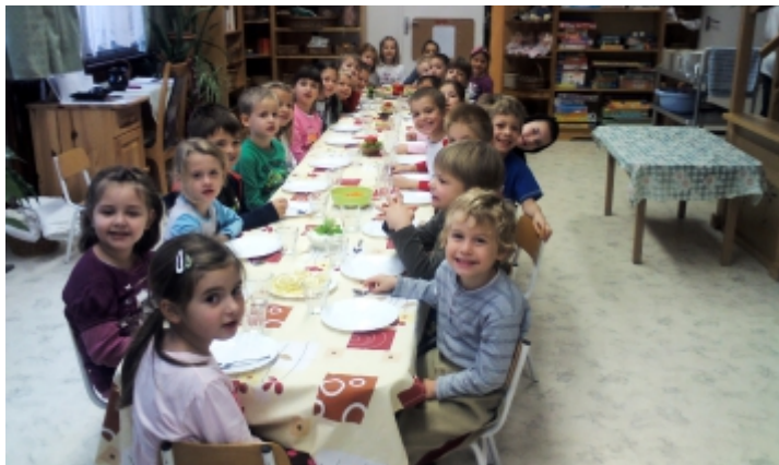
Az egészségtudatos életmód fontosságát is megtanulják a legkisebbek