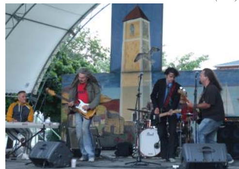
Színpadon a Keith Richard Rock & Roll Circus