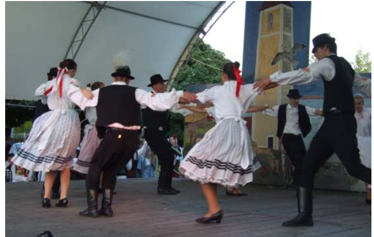
A Csupak Táncművészeti Egyesület is fellépett a Fürdő utcai színpadon

Az ünnepi ceremóniát követően sem állt meg az élet a Fürdő utcai nagyszínpadon – a Boka és a Klikk együttes egy igazi rock and roll show-műsort hozott Csupakra. Pénteken Csupak Táncművészeti Egyesület, valamint a lengyel, bolgár és erdélyi testvértelepülésekről érkezett művészeti csoportok adtak fergeteges műsort a nagyszínpadon. Az interkulturális kavalkádot a Hajdúböszörményi Ifjúsági Fúvószenekar zenészei és mazzoretjei követték, még bővebbé, izgalmasabbá téve az esti zenés-táncos repertoárt.