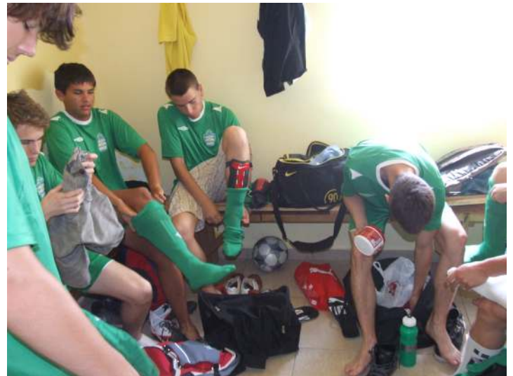
Augusztus végétől újra szerelést ölthetnek a csopaki fiatalok