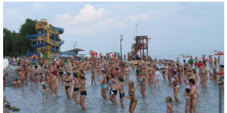
Földön vagy vízen: bírja a terhelést a strand

(folytatás a 2. oldalon „Beváltak az új jegytípusok” címmel.)