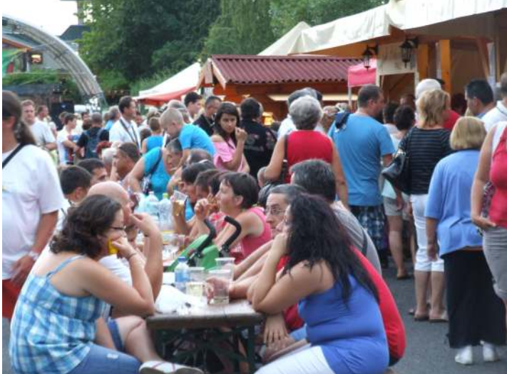
Idén is sokan látogattak ki a Fürdő utcai parkolóba

(folytatás a 2. oldalon „A rossz időt is állta a fesztivál” címmel)