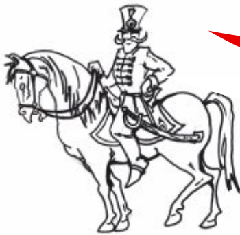
(Tombor Balázs grafikája)