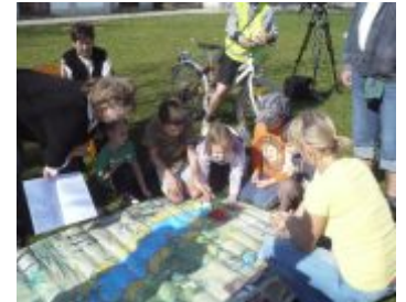
Megmozdultak a Víz Világnapján