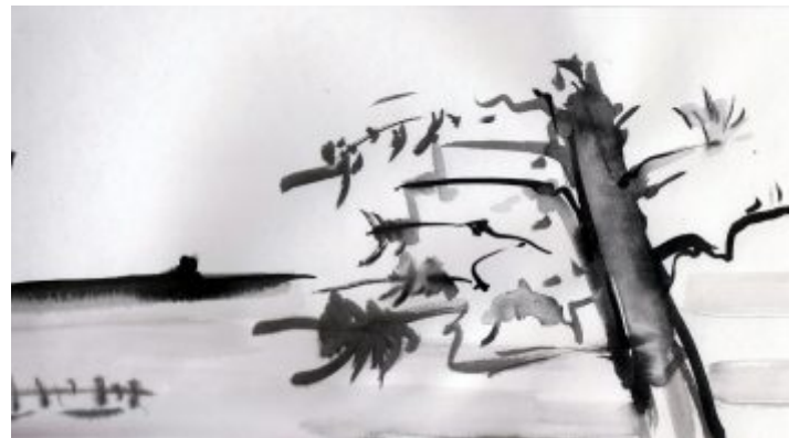
(Tombor Balázs grafikája)