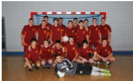
Alakulóban a jövő csapata

2012-ben a Csopak FC ifjúsági korosztályú együttese is bekapcsolódott a Balatonfüredi Kispályás Labdarúgó Szövetség (BKLSZ) szervezésben megrendezett hagyományos téli teremlabdarúgó bajnokság küzdelmeibe.