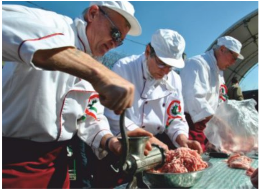
Töltés közben a Pápai Betyárok

A tavalyi évhez hasonlóan idén sem lehetett panasz az időjárásra, március 15-i nemzeti ünnepet követő napokban igazi tavaszi, napsütéses idő köszöntött a fesztivál résztvevőire. A főúti parkolóba települtek ki a borosgazdák, sajtókészítők, gombászok, házi lekvárarúsok, valamint a különféle hagyományos ételeket kínálók. A rendezvény nyitó estjén az „Utazó Blues Fesztivál” három fellépő formációja közel négy órán át szórakoztatta a közönséget klasszikus rhythm, blues és rock dalokkal, Rolling Stones-feldolgozásokkal, valamint saját szerzeményekkel a közönséget. Szombaton tradicionális falusi disznóvágással indult a nap... (Folytatás a 2. oldalon "Telt ház a Boros Toroson" címmel.)