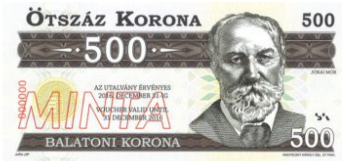
Ötszázás címlet, Jókaiival