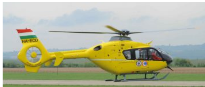
A füredi ment állomáson