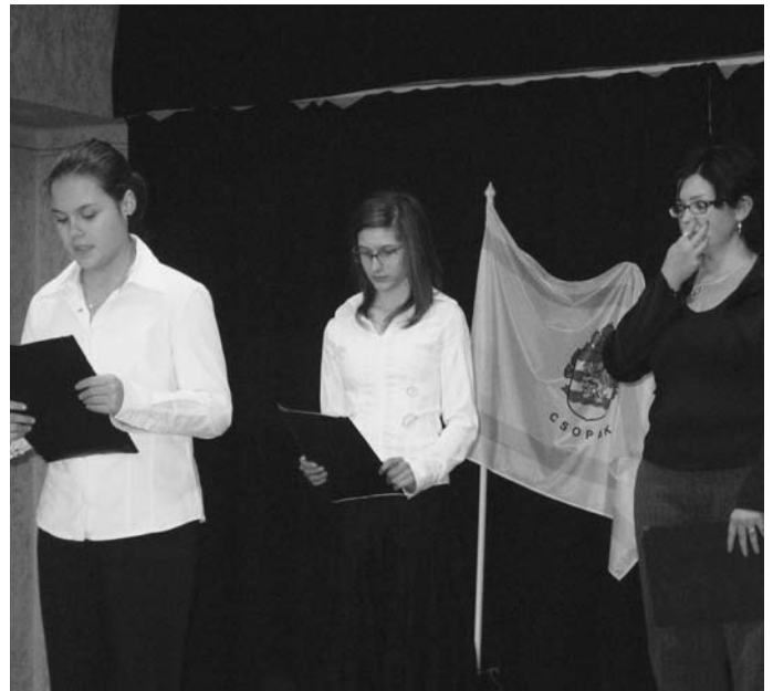
Az általános iskola diákjai Radnóti verseket szavaltak