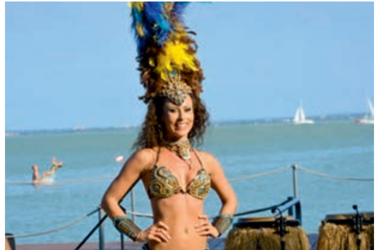
Ritmo Carnaval fellépőivel, amelyet az Intermezzo Latin Klub koncertje követett.

Szombaton, ottjártunkor is folytatódott a Solymi Conga Show és a csodaszép táncosok riói hangulatot idéző tánca a Reinas Del