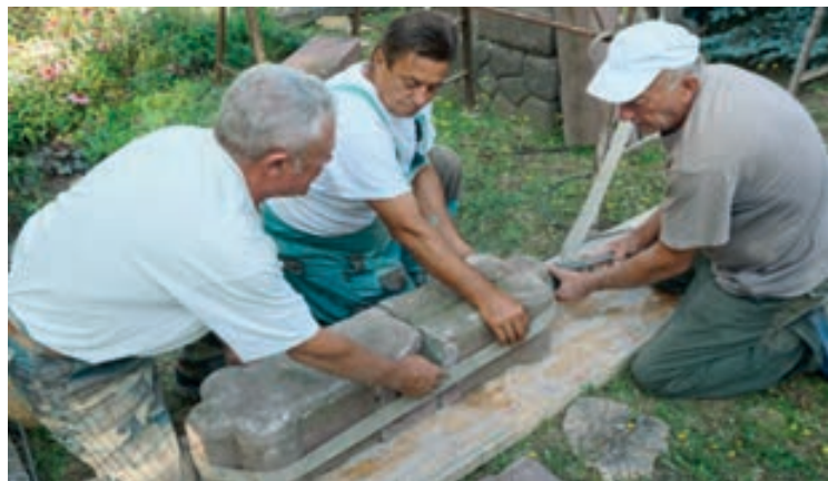
A ledöntött kereszt helyreállítási munkálatai