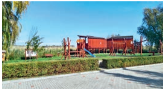
Madárles és csillagvárta

A Sport utca és az Ifjúság sétány találkozásánál található pihenőhely. A Balaton kerékpárút itt halad el. Hosszabb túra közben megpihenhetünk, de egész éves kikapcsolódást is nyújt a természetes közegben épített létesítmény együttes. A hatalmas fűzfa alatt álló Kerékpáros Pihenő fedett része, akár zord időben, esőben is védelmet nyújt a pihenni vágyóknak. Padok, asztalok, vízvételi lehetőség és szemetes áll a rendelkezésünkre, autós parkolóhelyek is vannak a pihenőhelyen. A biciklipihenőt óriási fűzfák alatti kis fahíd köti össze a Madárles és Csillagvárta létesítménnyel. Játsszótér áll a kicsik rendelkezésére,