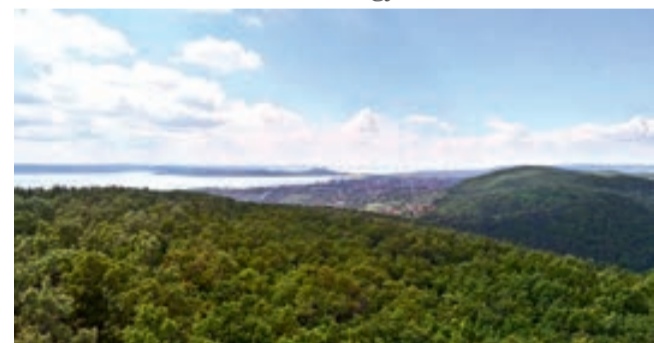
Csodálatos panorámában gyönyörködhetünk

a végéről is kék turistajelzés visz fel. Padok és asztal van kihelyezve, viszont tábla figyelmeztet a tűzgyújtás tilalmára. Ha valaki felmegy a kilátóra csodálatos