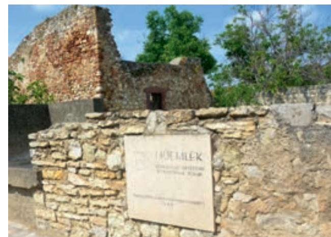
Szent Miklós templomrom

A Kossuth utca közepén találjuk, Kövesd Szent Miklós templomromját. Első írásos emlék a templomról 1363-ból való. Valószínű, hogy a „török időkben” vált romossá. Az üres romot „puszta templomnak” is említik. Az 1783-as térképen „Eine alte schon zerfallene Kirche” egy öreg, már elpusztult templom, megjegyzés van. A kövesdi nemesek nagy része az új kálvini vallás mellé álltak és szerették volna megkapni és felépíteni a templomot. 1796-ban kérték a veszprémi Káptalantól, de nem jártak sikerrel. 1800-évek elején a Kövesdi Nemesi Közbirtoosság veszi meg és javítja ki a falakat és nádtetővel látja el. A községi pástornak lett a pajtája és mellé építették a bika istállót és a pástornházat. Rómer Flóris OSB. régész 1861-ben már az istállónak-pajtának átalakított épületet látta. Kelet-nyugati fekvésű,