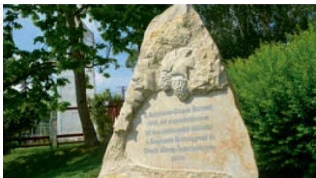
Szintén itt található a 2009-ben emelt Borrendek Emlékműve