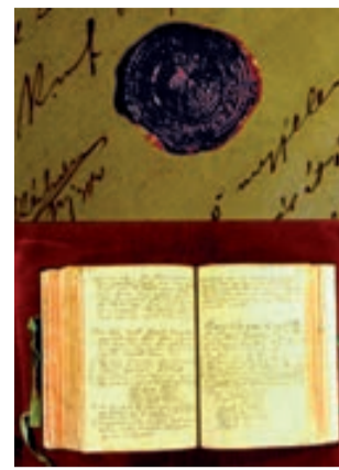
Csopaki Hegyközség jegyzőkönyve

magasabb szinten, a megyei értéktárban is megjelenjen, vagy akár hungarikum szintre is felterjesztenénk. Veszprém megye eddig egy hungarikummal büszkélkedhet a Herendi porcelánnal. Tervezzük, hogy kiadványokban is megjelentetjük Csopak Község szellemi és tárgyi értékeit, emlékeit. A Csopaki Települési Értéktárnak továbbra is feladata, hogy a fellelhető nemzeti értékeket településünkön azonosítsa és nyilvántartásba vegye. Ezek az értékek lehetnek írott vagy íratlan, szellemi vagy tárgyi hagyatékok, de néprajzi vagy természeti kincsek is. A helyi közösségek összefogása, a lokálpatriotizmus mellett fontos szempont lehet az idegenforgalom is, hiszen a település épített öröksége egyben népszerű turisztikai célpontokká is válhatnak. Hangsúlyozom, hogy bárki, írásban kezdeményezheti a nyilvántartásba vételt. Ezt a javaslatot be kell nyújtani a Települési Értéktár Bizottságnak, akik soron következő ülésükön megtárgyalják a betérjesztést és szavaznak annak értéktári felvételéről.