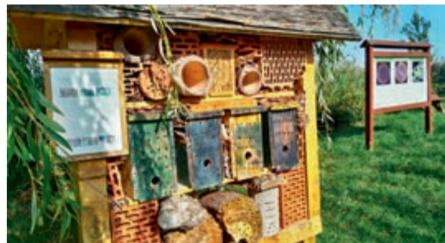
Úgynevezett rovarhotel, különféle kis élőlényeknek

A Sport utca és az Ifjúság sétány találkozásánál található pihenőhely. A Balaton kerékpárút itt halad el. Hosszabb túra közben megpihenhetünk, de egész éves kikapcsolódást is nyújt a természetes közegben épített létesítmény együttes. A hatalmas fűzfa alatt álló Kerékpáros Pihenő fedett része, akár zord időben, esőben is védelmet nyújt a pihenni vágyóknak. Padok, asztalok, vízvételi lehetőség és szemetes áll a rendelkezésünkre, autós parkolóhelyek is vannak a pihenőhelyen. A biciklipihenőt óriási fűzfák alatti kis fahíd köti össze a Madárles és Csillagvárta létesítménnyel. Játsszótér áll a kicsik rendelkezésére,