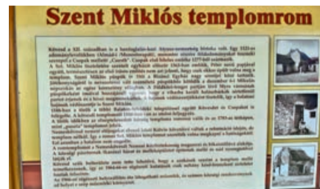
A templomrom története információs táblán, benn a romkertben

A Kossuth utca közepén találjuk, Kövesd Szent Miklós templomromját. Első írásos emlék a templomról 1363-ból való. Valószínű, hogy a „török időkben” vált romossá. Az üres romot „puszta templomnak” is említik. Az 1783-as térképen „Eine alte schon zerfallene Kirche” egy öreg, már elpusztult templom, megjegyzés van. A kövesdi nemesek nagy része az új kálvini vallás mellé álltak és szerették volna megkapni és felépíteni a templomot. 1796-ban kérték a veszprémi Káptalantól, de nem jártak sikerrel. 1800-évek elején a Kövesdi Nemesi Közbirtoosság veszi meg és javítja ki a falakat és nádtetővel látja el. A községi pástornak lett a pajtája és mellé építették a bika istállót és a pástornházat. Rómer Flóris OSB. régész 1861-ben már az istállónak-pajtának átalakított épületet látta. Kelet-nyugati fekvésű,