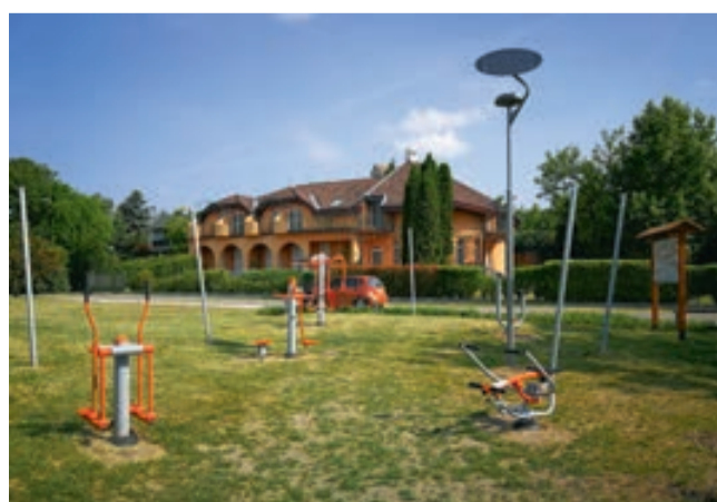
Apáca strandnál fitnesspark

A Balaton Fejlesztési Tanács támogatásával, egy korábbi sétányfejlesztési projekthez kapcsolódóan, Csopak nyugati sétányszakaszán horgász és kerékpáros pihenőt alakítottak ki. Az Apáca strandnál egy fitnesspark épült. Mindez tovább emeli az infrastruktúra színvonalát, a vendégek komfortérzetét. A 10 milliós költség felét a Balaton Fejlesztési Tanács biztosította.