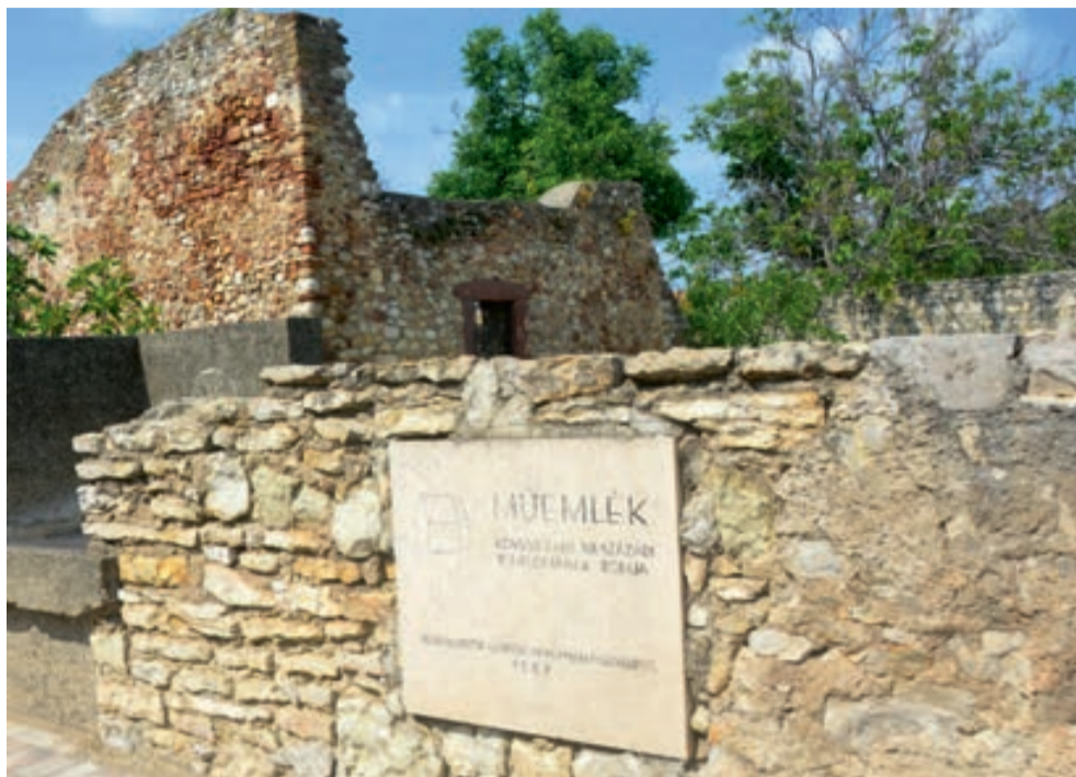
Szent Miklós templomrom

malmok is szerepet játszottak a hely történetében. A Kókoporsó dombon lévő római kori régészeti lelőhelyen talált borospince az ősi szőlőkultúra egyik bizonyí-