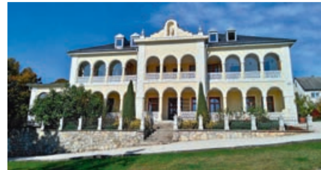
Az angolkisasszonyok nyaralója most a Nemzeti Park Igazgatóságának ad helyet

Az Angolkisasszonyok Apácastrandnak volt a nyaralója. Veszprémben iskolát fenntartó tanító rendet Ranolder János püspök hívta Veszprémbe, zárdát, iskolát és internátust (kollégium) épített számukra. Elemi népiskola, polgári, tanítóképző és felső kereskedelmi oktatás folyt. A tanárnőknek volt a nyaralója Csopakon melyet a XIX.-XX. század fordulóján építettek. Kápolna is volt benne, így sokan oda jártak misére nyáron, míg 1934-ben meg nem épült a