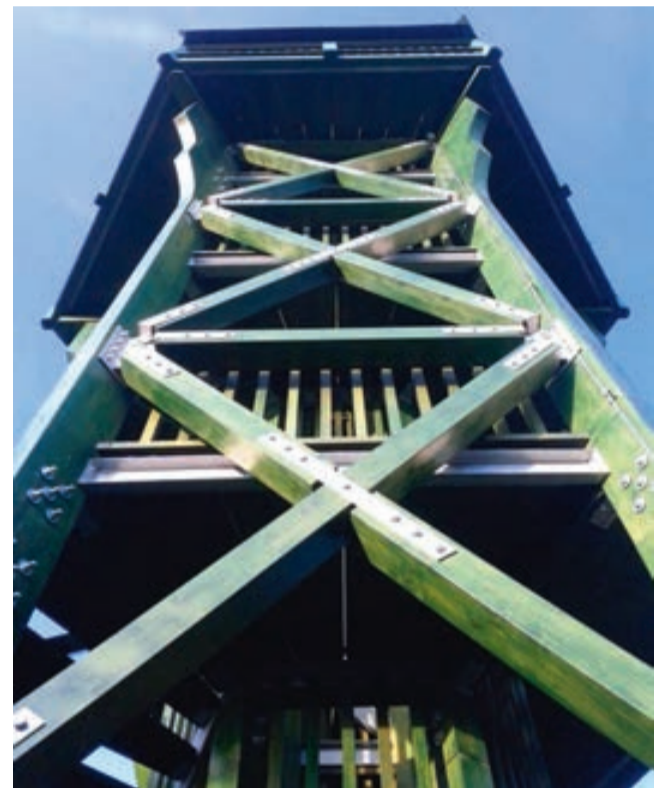
Csákány hegyi kilátó

Több felől meg lehet közelíteni a 327 méteren álló Csákány-hegyi kilátóját. Három éve újították fel, immáron még magasabbról nézhetünk szét, mint annak előtte. Csopak felől a Csákányhegyi utca elejéről (első szakasz meredek kaptató a fenyvesek között) és