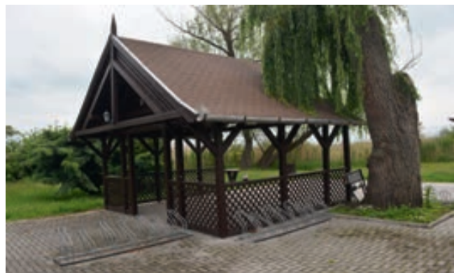
A Balatoni kerékpárút mellett a fűzfánál található a Kerékpáros Pihenő

amíg a nagyobbak információs táblákon olvashatnak a csillagásatról, a csillagokról. Közvetlen a nádas mellett áll az úgynevezett „rovarhotel”, számtalan kis rovar élőhelyének kialakításával. Pár méterre képes tájékoztató táblák találhatók a helyi élővilágról. A Madárlesre felmenvén rálátunk a nádasra, a Balatonra, Paloznak és Alsóörs irányába. Ha csendben maradunk egy ideig, akkor halljuk, látjuk a természet nyüzsgését. A Madárlesnél ingyenes Wi-fi áll rendelkezésünkre, pad és szemetes itt is van. A strand irányába továbbhaladva pedig kb. száz méterre található a Meztlábás Ösvény és szabadtéri Fitness Park.