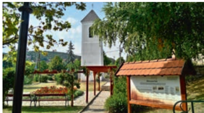
A Millenniumi Park felső része, a Csonkatoronynál