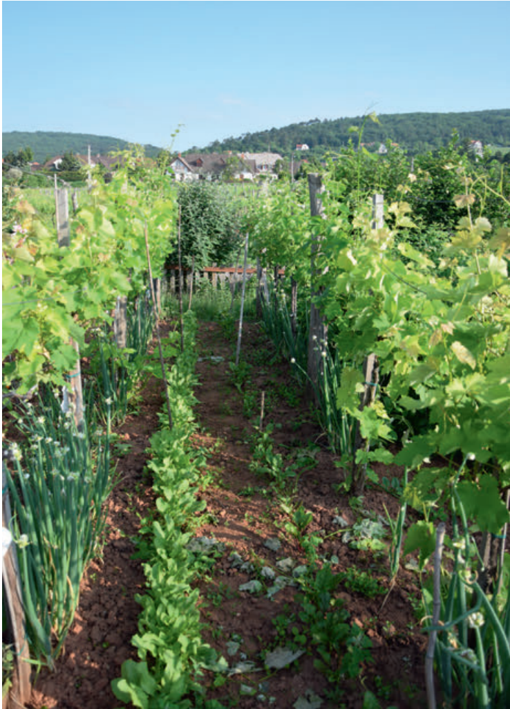
A sorok alatt a hagyma és a sorok között a spenót és cékla kiváló példája a egyes ültetésnek