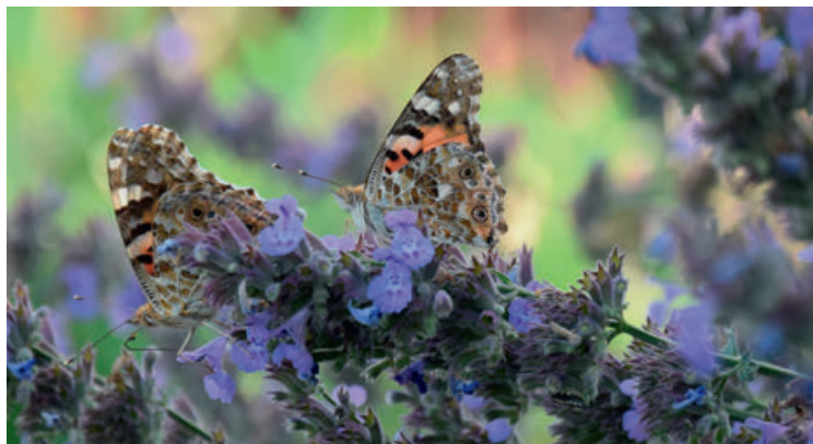
A kerti rovarok segítik a haszonnövények terméshozamát

Magánemberként és polgármesterként is azt gondolom, hogy a természetvédelem nemcsak településszintű feladat, alapvető, hogy áthassa mindennapi gondolkodásunkat, tevékenységünket. Azt, ahogyan vásárolunk, ahogyan a háztartásunkban keletkező hulladékot kezeljük, és természetesen, ahogyan a kertünket gondozzuk.