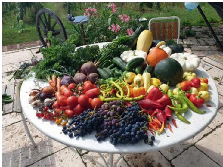
A megfelelő ültetés és gondozás meghozza gyümölcsét: vegyszermentes bőséges termés

Vannak olyan hidegnek ellenálló növények, melyeket már márciusban elvethetünk az első ágyásokba. Ilyen például a sárgarépa, a borsó, a vörshagyma, a petrezselyem, a hónapos retek, a saláta, a spenót, a vörös-, lila- illetve a fokhagyma. A hagymaféléket én dughagymáról szoktam szaporítani. Ha nem ismerjük pontosan a vetési időszakokat, az interneten vagy szakmai kiadványokban fellelhető vetési naptárak segítségünkre lehetnek a tervezésben.