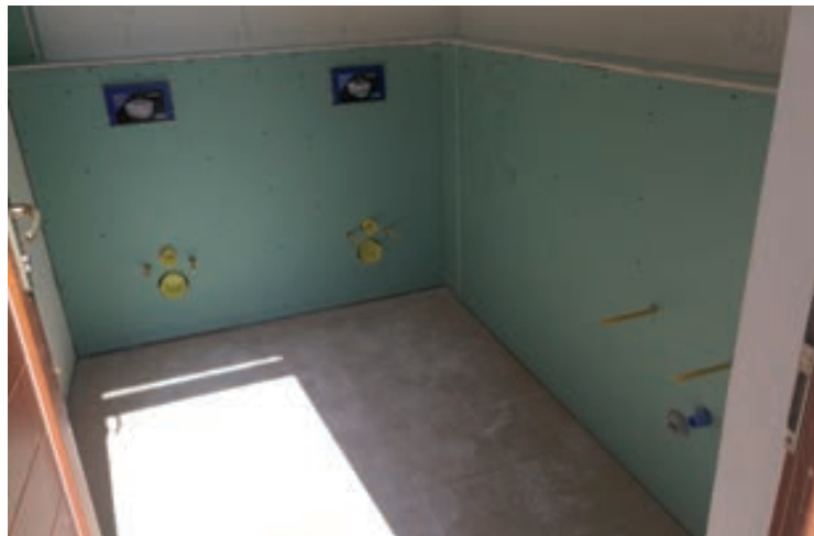
Hamarosan elkészül az új családi mosdó

sági helyzetre való tekintettel az önkormányzati önrész jelen helyzetben nem biztosított, ezért a megvalósításra rendelkezésre álló időkeret meghosszabbítását kihasználva az említett érintett utcák kivitelezése a későbbi évekre áthúzódik.