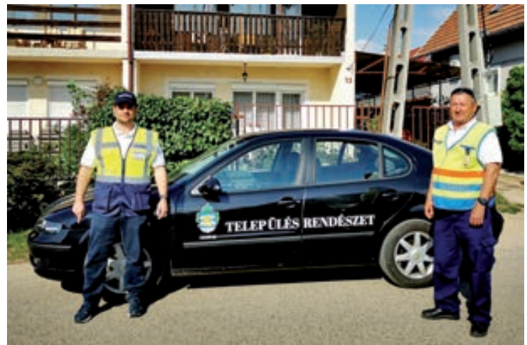
Polgárőreink jelenleg saját járóautó híján a Csopaki Település Rendészet autójával látják el feladataikat.

A csopaki fiatalok bevonása is céljaink egyik fontos pillére. A vírus helyzet kezelésére egyesületünk kezdeményezte a Csopaki Önkéntes Segítők csoport megalakítását, amelyben jelenleg 21 fő áll készenlétben, hogy szükség esetén plusz emberi erőforrással nyújthassanak segítséget (a cikk megírásáig olyan szerencsés helyzetben vagyunk, hogy a Csopaki Önkéntes Segítők csoport tagjait nem kellett bevonnunk, a jelenlegi feladatok ellátása folytonos, megoldott).