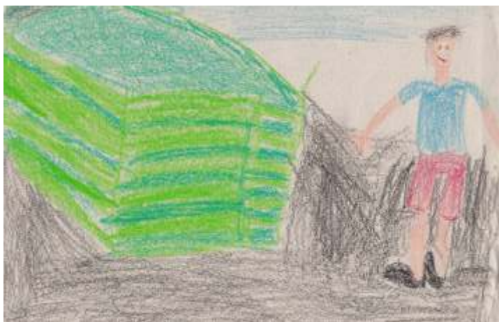
Zsebe Kornél rajza