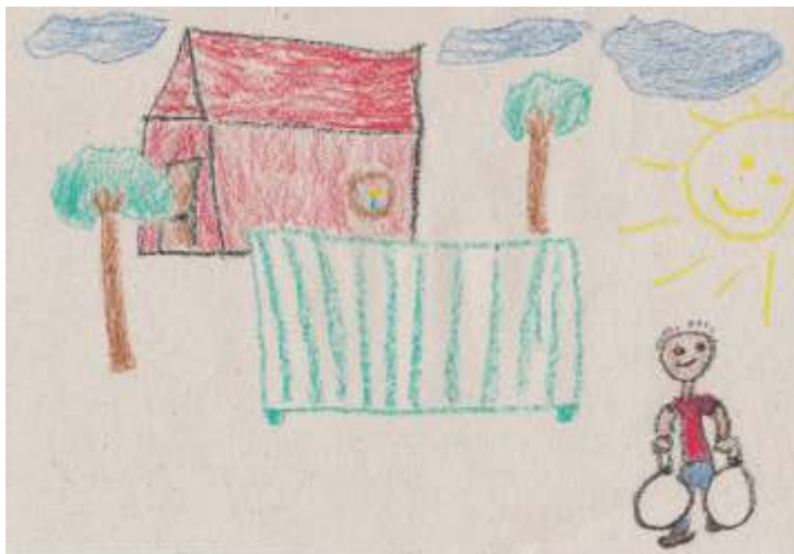
Steinhausz Gergő alkotása