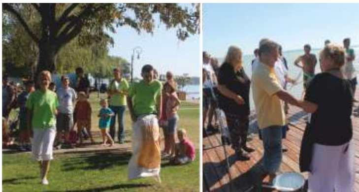
Népszerűek voltak a sport- és gasztroprogramok